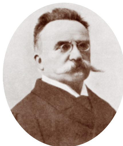
(de izquierda a derecha). El parlamentario francés Frédéric Passy y el parlamentario británico, William Randal Cremer, co-fundadores de la UIP, y el parlamentario suizo, Albert Gobat, primer Secretario General de la UIP.