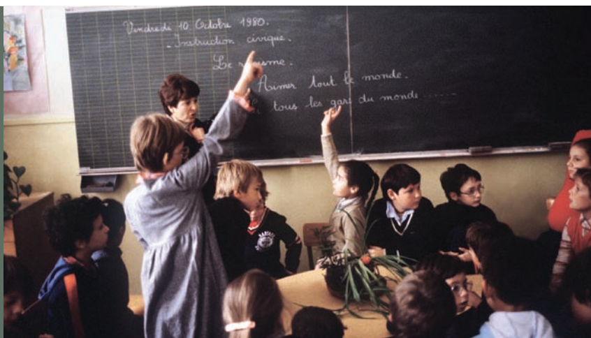
▲ Clase de educación cívica, Francia.

Fuente: Finkel. "Can Democracy be Taught?" Journal of Democracy : 14(4): Octubre de 2003.