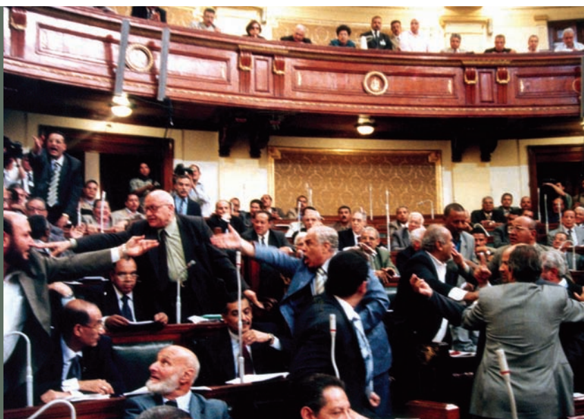
▲ Sesión parlamentaria para la introducción de enmiendas a la Constitución, Egipto, mayo de 2005. © AFP Photo/STR

Fuente: "Panorama de las elecciones parlamentarias en 2008." UIP