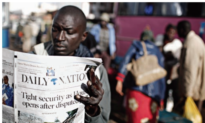
▲ Los medios de comunicación dan cuenta de la violencia postelectoral, Kenya, enero de 2008.

Una sociedad en la que no se garantiza la libertad de expresión dificulta la tolerancia política. La cultura de la tolerancia propicia y fortalece el diálogo franco y la diversidad de opiniones políticas.