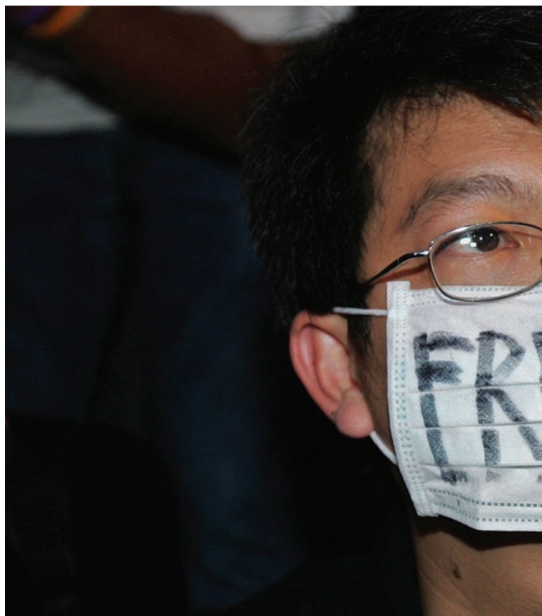
▲ Protesta estudiantil contra el golpe militar, Tailandia, 22 de septiembre de 2006.

—Informe del Relator Especial sobre la promoción y protección del derecho a la libertad de opinión y de expresión E/CN.4/75/2002, enero de 2002