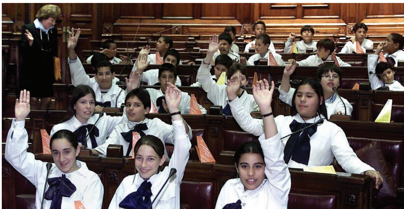
▲ Parlamento de los niños, Uruguay.