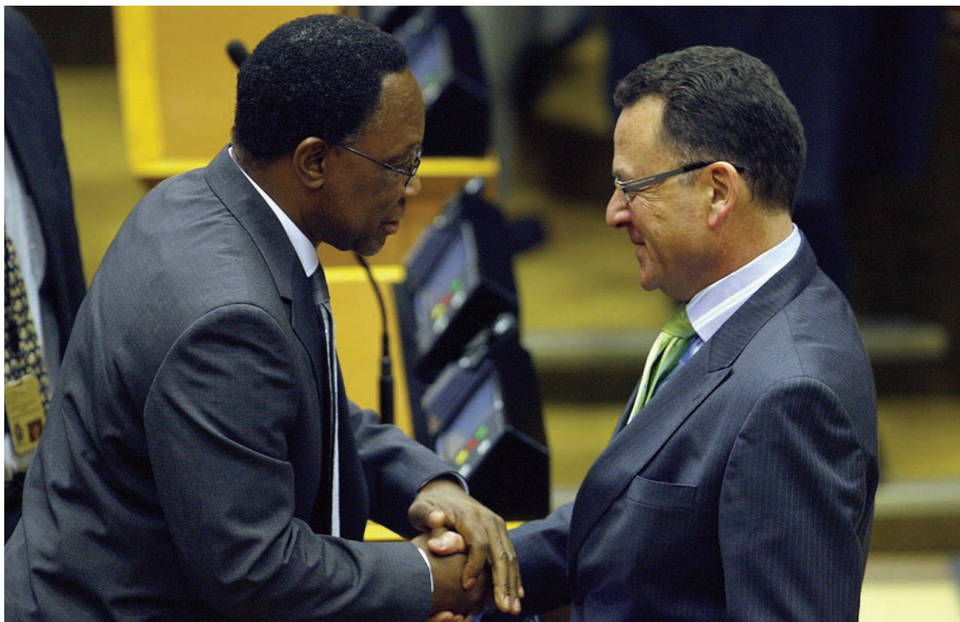
▲ Kgalema Motlanthe (ANC) y Tony Leon (Alianza Democrática), Sudáfrica, septiembre de 2008.

La tolerancia política es, pues, imprescindible para el funcionamiento de los parlamentos, y debería perseguirse activamente en la práctica.