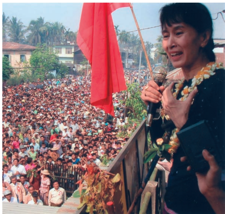
▲ Aung San Suu Kyi hablando en un mitin en el Estado de Arakan, Myanmar 2002